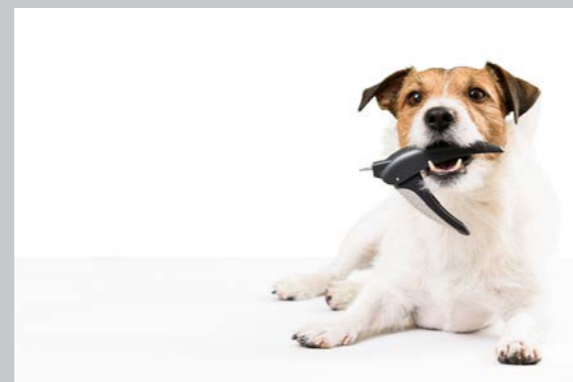
Sidan 24 - Kloklippning