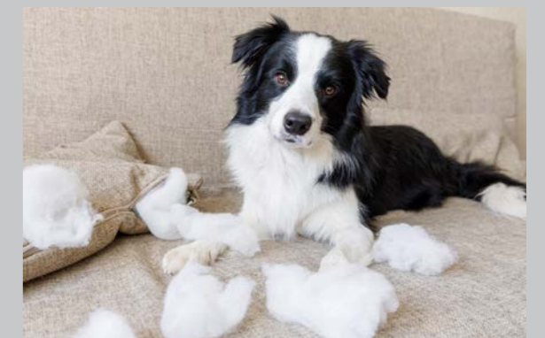
Sidan 46 - Stress

Ansvarig utgivare: Johan Sandwall Utgivare: Ny Media Sverige AB Tryck: Åtta.45 Upplaga: 100 000 ex / 7 Läsare tidning + webb: 300 000 st