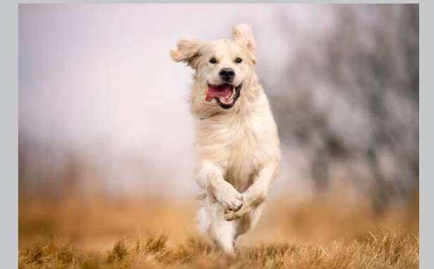
Sidan 34 - Motion