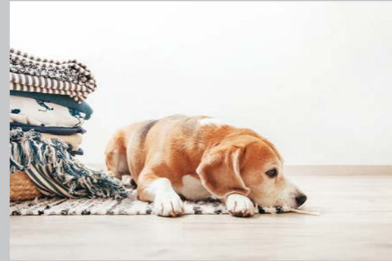
Sidan 8 - Ensamträning