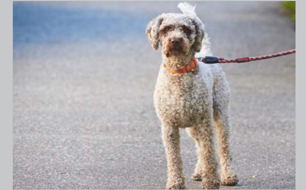
Sidan 25 - Koppelträning