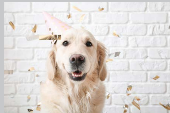
Sidan 16 - Hundår till människoår