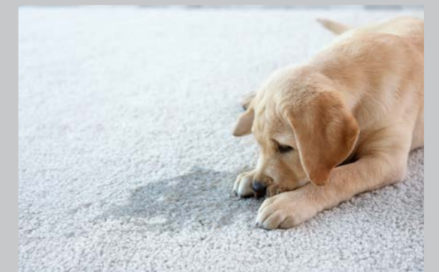
Sidan 42 - Rumsrenhet